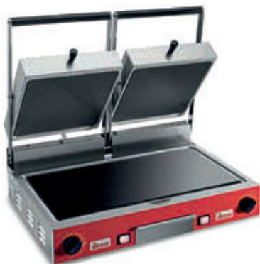
PD VC LR-LR