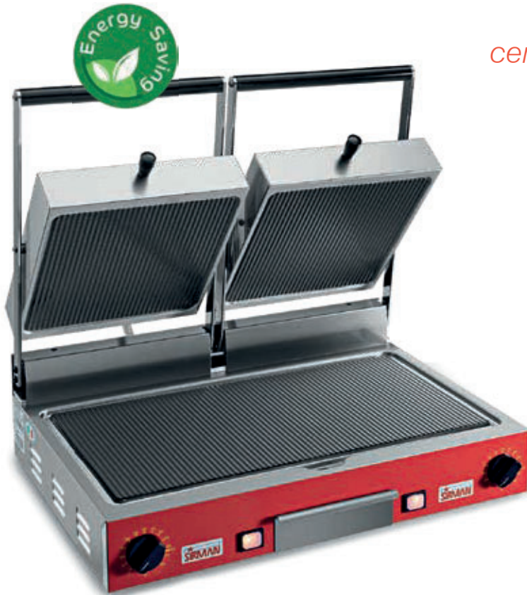
PD VC RR-RR