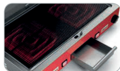
Cassetto raccolta liquidi e residui di cottura Useful drip tray for liquids and other cooking leavings